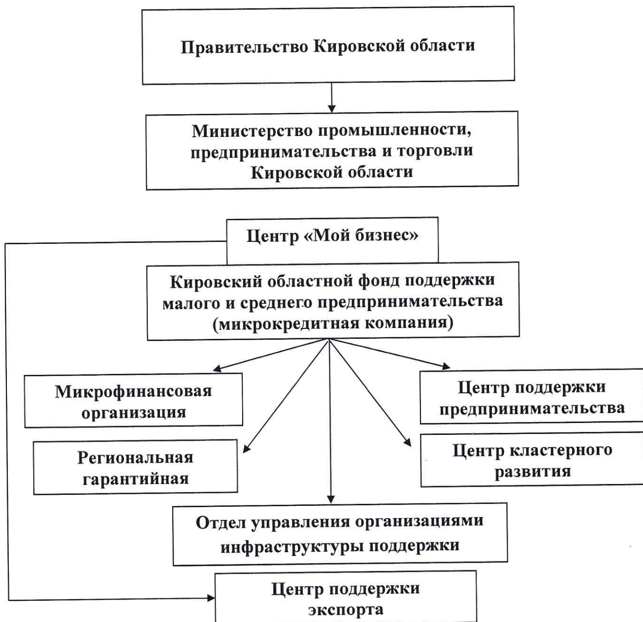
Схема № 1

С 2017 года функции ЦПП осуществляются отделом поддержки предпринимательства, который является структурным подразделением Фонда. Одним из учредителей Фонда является министерство промышленности, предпринимательства и торговли Кировской области. Организационные, бухгалтерские, юридические и планово-хозяйственные аспекты деятельности ЦПП находятся в непосредственном ведении Фонда. Штатная численность сотрудников ЦПП – 5 штатных единиц. Система управления представлена на схеме № 1.